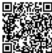
HOJA DE SEGURIDAD